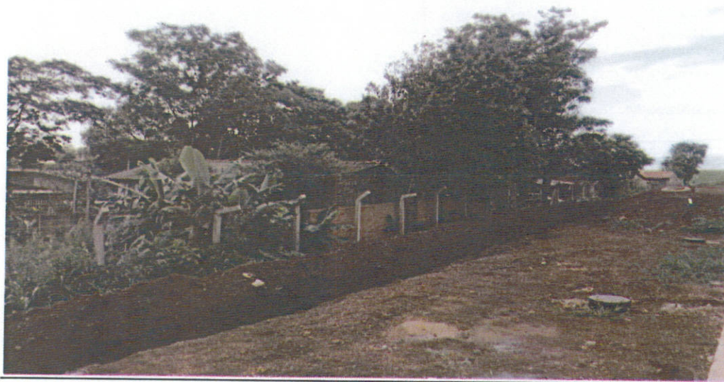
Imagem 1. Valeta aberta pela Empresa responsável com o objetivo de canalizar a água até o rio, e, ao lado, imóveis afetados.