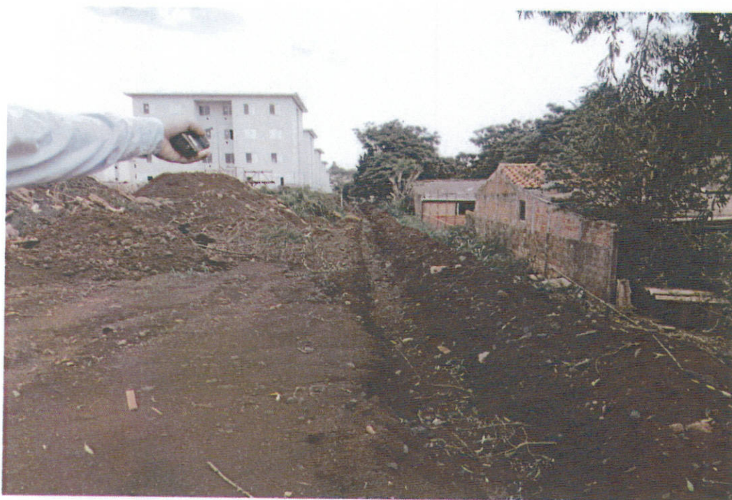
Imagem 2. Visão Geral da Situação.