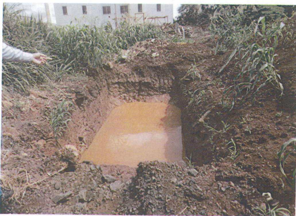
Imagem 3. Sistema de captação para contenção da água que desce da rua.