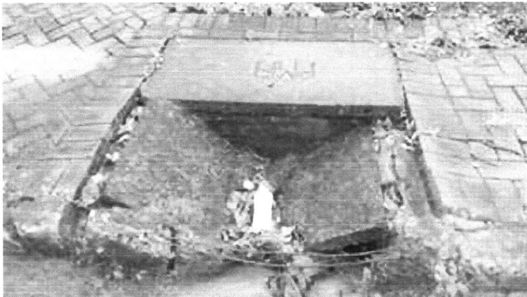
Imagem 01. Tampa do Bueiro em frente ao nº 345.