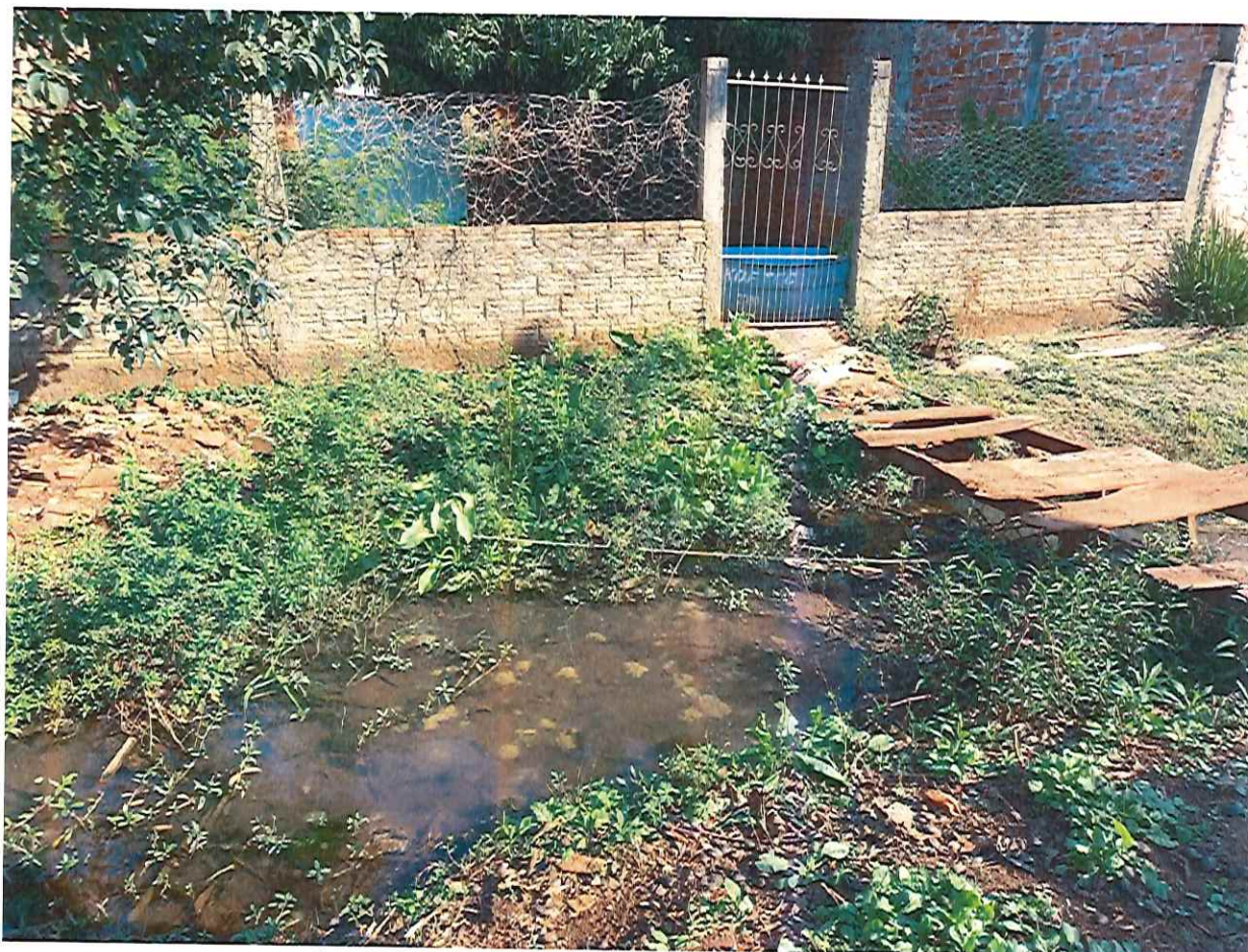
Imagem 1: Local apontado na Rua Flávio Cavalieri.