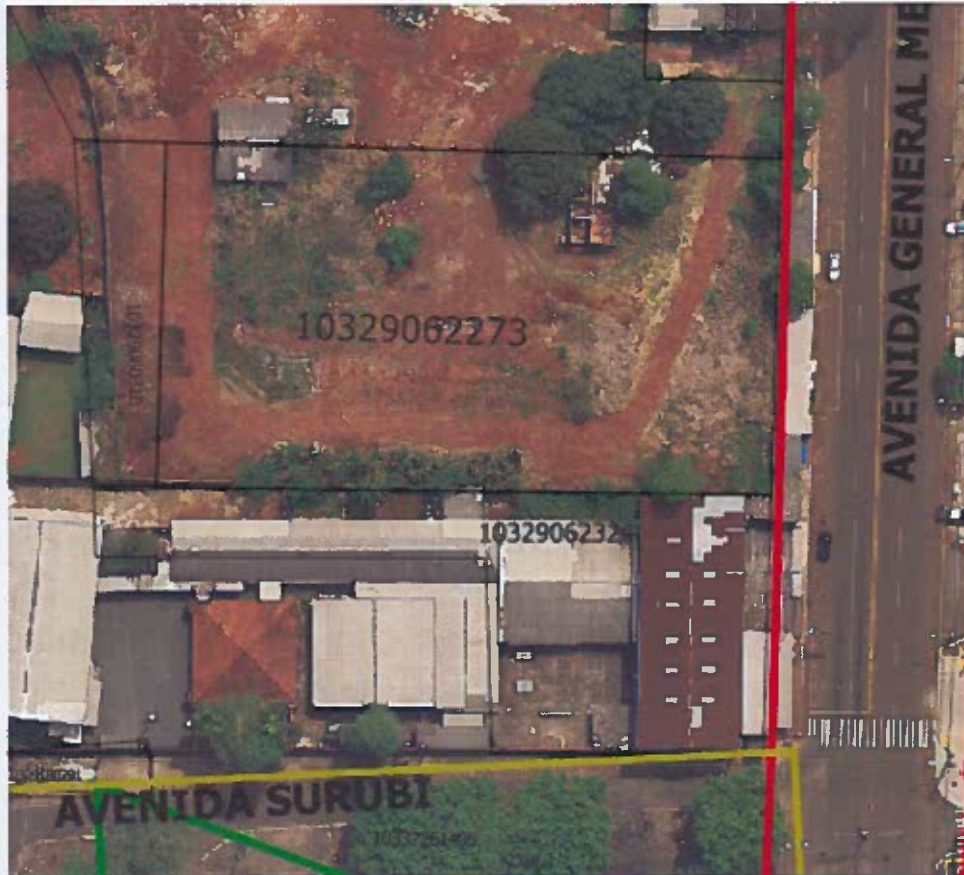
Figura 1 Mapa do local indicado;