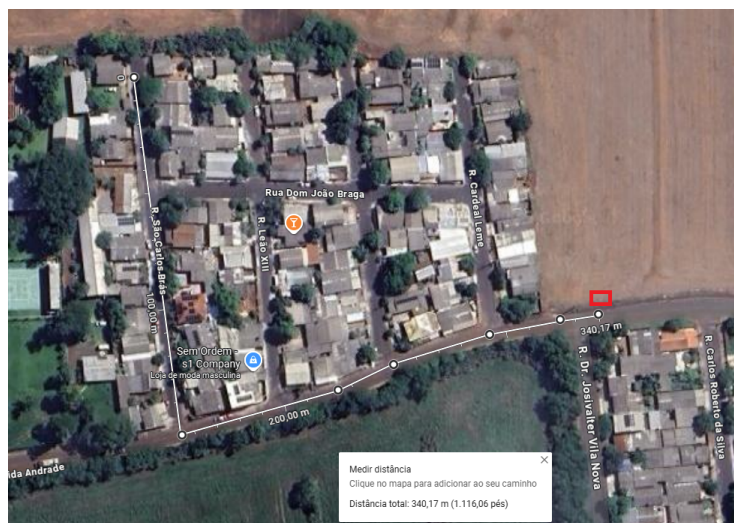
Mapa com a indicação do ponto de embarque e desembarque.

Diante disso, foi necessária a alteração do itinerário da referida linha. Estes ajustes não apresentam nenhum contratempo para os usuários do serviço do Transporte Coletivo Urbano, considerando que foi instalado um ponto de embarque e desembarque na Av. Ângela Aparecida Andrade, esquina com Rua Dr. Josivalter Vila Nova, ou seja, na entrada do Jd. Califórnia II, de forma que os moradores da localidade mais extrema do Bairro terão que caminhar no máximo 340m até o local de embarque e desembarque, sendo esta distância perfeitamente aceitável para esta finalidade. Assim, a região continua sendo atendida pelo serviço de Transporte Coletivo Urbano.